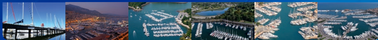
Marseillan Monaco Bénodet Port-la-Forêt Fréjus Antibes